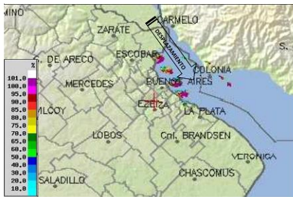
Figura 3. Composición del producto probabilidad de granizo del software Meteoview para las horas 10:30, 10:40, 10:50, 11:00 y 11:10UTC. Colores rosados indican una alta probabilidad de ocurrencia de granizo.