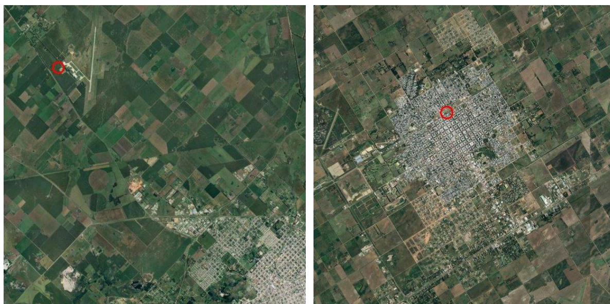
Figura 3: Ubicación de las estaciones meteorológicas Tandil (izquierda) y Trenque Lauquen (derecha) y recorte de imagen satelital del entorno de cada una de ellas.

Conclusión: La correlación entre la temperatura medida en la estación en abrigo meteorológico (2m) con la estimada a partir del producto LST horario (superficie) es muy significativa en el área analizada, aunque el ajuste es menor para áreas costeras. Si bien se trata de un producto óptico, es decir, no disponible en presencia de nubosidad, se verificó que raramente esto ocurre en noches frías.