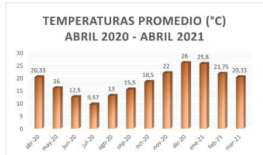
Imagen N°3: Temperaturas mensuales promedio (2020-2021)